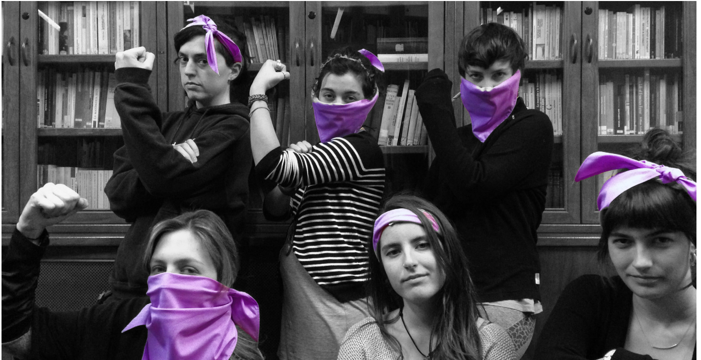
Equip de gènere d'AEC, EC i MEG